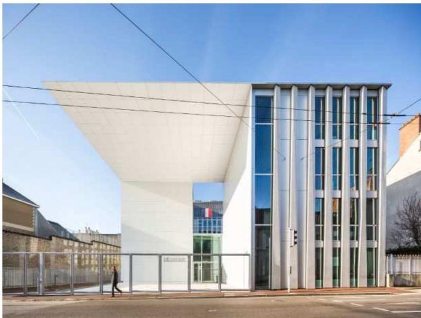
Palais de justice de Limoges réalisé en décembre 2016 par l'agence Nicolas Michel & Associés (ANMA)