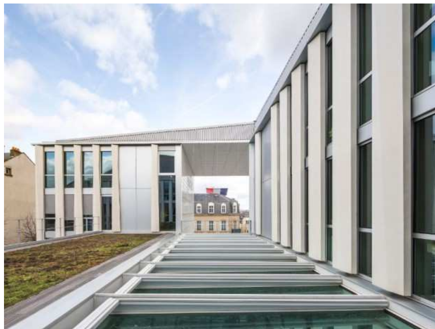
Palais de justice de Limoges réalisé en décembre 2016 par l'agence Nicolas Michel & Associés (ANMA)

L'espace extérieur entièrement recouvert de carreaux de porcelaine de Limoges