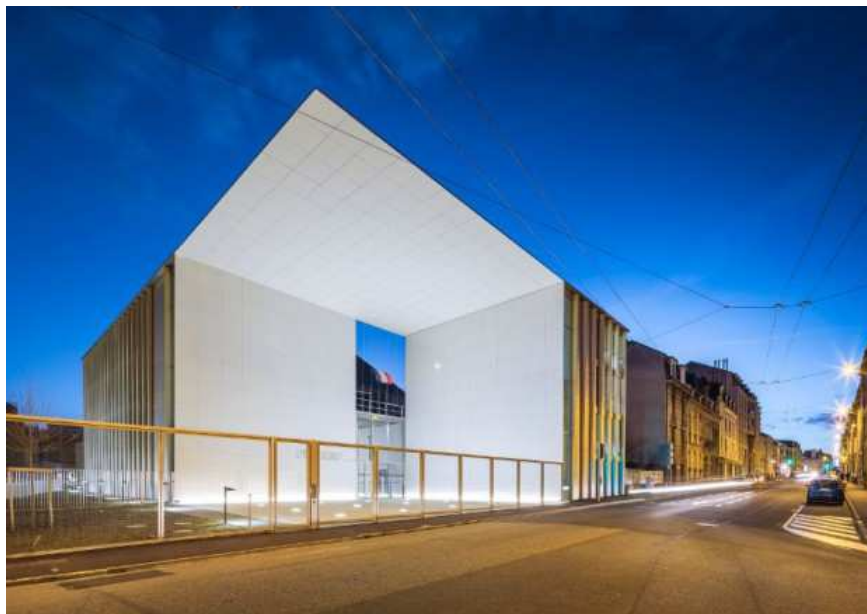
Palais de justice de Limoges réalisé en décembre 2016 par l'agence Nicolas Michel & Associés (ANMA)