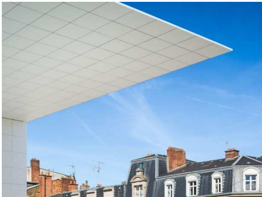
Palais de justice de Limoges réalisé en décembre 2016 par l'agence Nicolas Michel & Associés (ANMA)