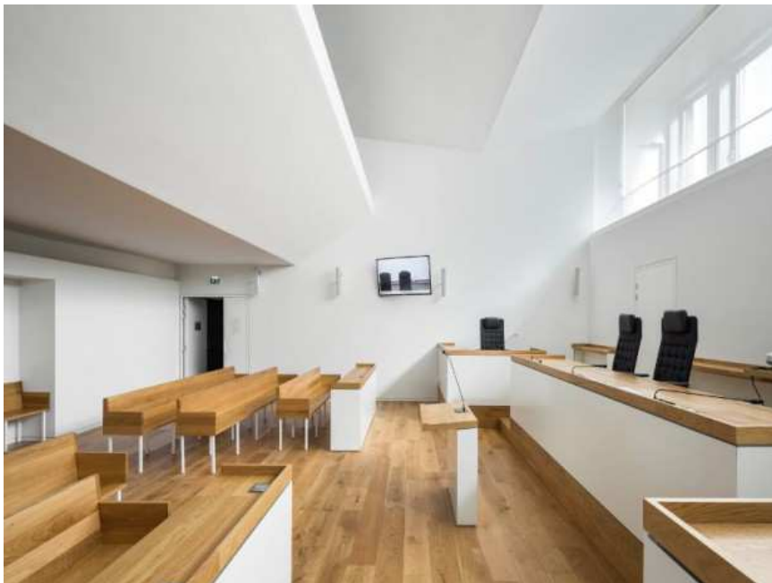
Palais de justice de Limoges réalisé en décembre 2016 par l'agence Nicolas Michel & Associés (ANMA)