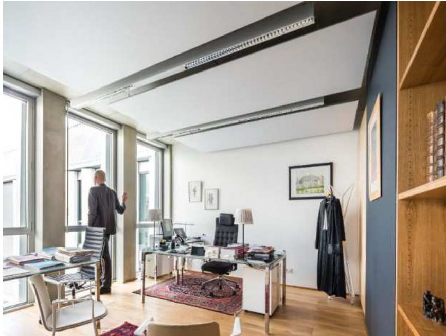
Palais de justice de Limoges réalisé en décembre 2016 par l'agence Nicolas Michel & Associés (ANMA)