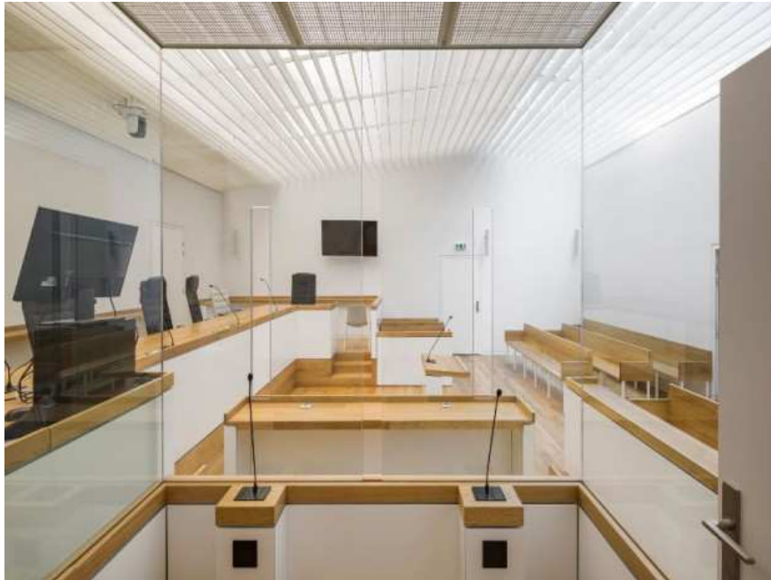
Palais de justice de Limoges réalisé en décembre 2016 par l'agence Nicolas Michel & Associés (ANMA)