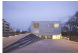
Mairie St-Jacques de-la-Lande. LAN Architecture Le 27/07/2016