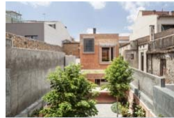
House 1014 - Harquitectes Le 16/07/2016