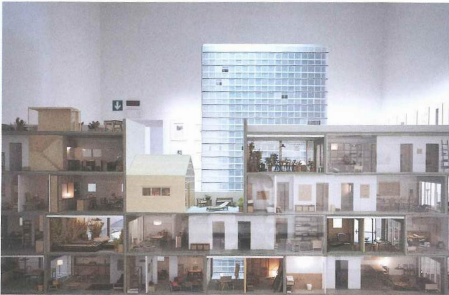
↓ Installations de LAN au Pavillon central des Giardini à la Biennale de Venise, Nouvelles du front

bâtiments ont été démolis; le second traite de recyclage, une intervention sur l'existant qui met en valeur le déjà-là au lieu de le remplacer. Dans les deux cas, le défi est d'atteindre une densité optimale tout en repensant la notion de logement collectif et d'échelle humaine. Ces deux cas pourraient contribuer à forger les nouveaux standards, valeurs et désirs, devenant une version actualisée du Chapitre d'Athènes, où l'hygiène et l'efficacité laissent place à la ville comme raccourci vers l'égalité. »