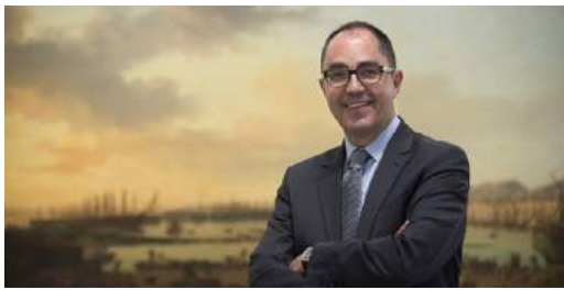
Jean-Luc Martinez, président-directeur du Louvre, le 4 mai 2016 à Liège